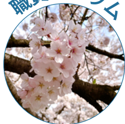
仙台市重度障害者 コミュニケーション 支援センター 職員